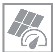
Hohe Effizienz für zuverlässige Erträge