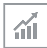
Anlageoptimierung, höhere Erträge